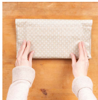
3. Umschlagkante nach oben