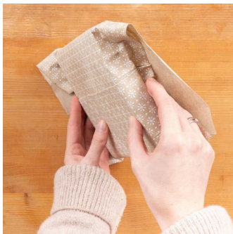
5. Obere Seiten um das Geschenk nach innen falten