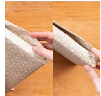
8. Nach innen schieben. Kanten und Ecken vorsichtig nachglätten