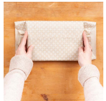
4. Obere Seiten mit beiden Händen an die Kante anpassen