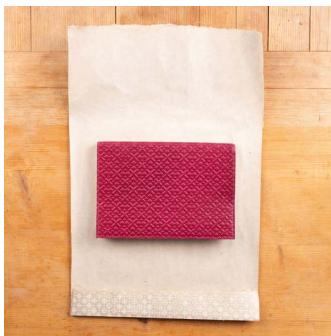
1. Papier auf Größe schneiden, Unterkante umknicken