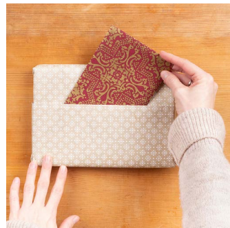
Unser Tipp: Nutze die Umschlagkante für eine Karte oder für andere Dekoelemente