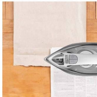
Wiederverwenden: Knicke unter Zeitungspapier auf niedriger Temperatur vorsichtig ausbügeln