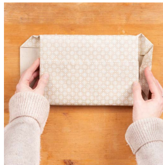
7. Hinterseite ebenso hinter das Geschenk falten